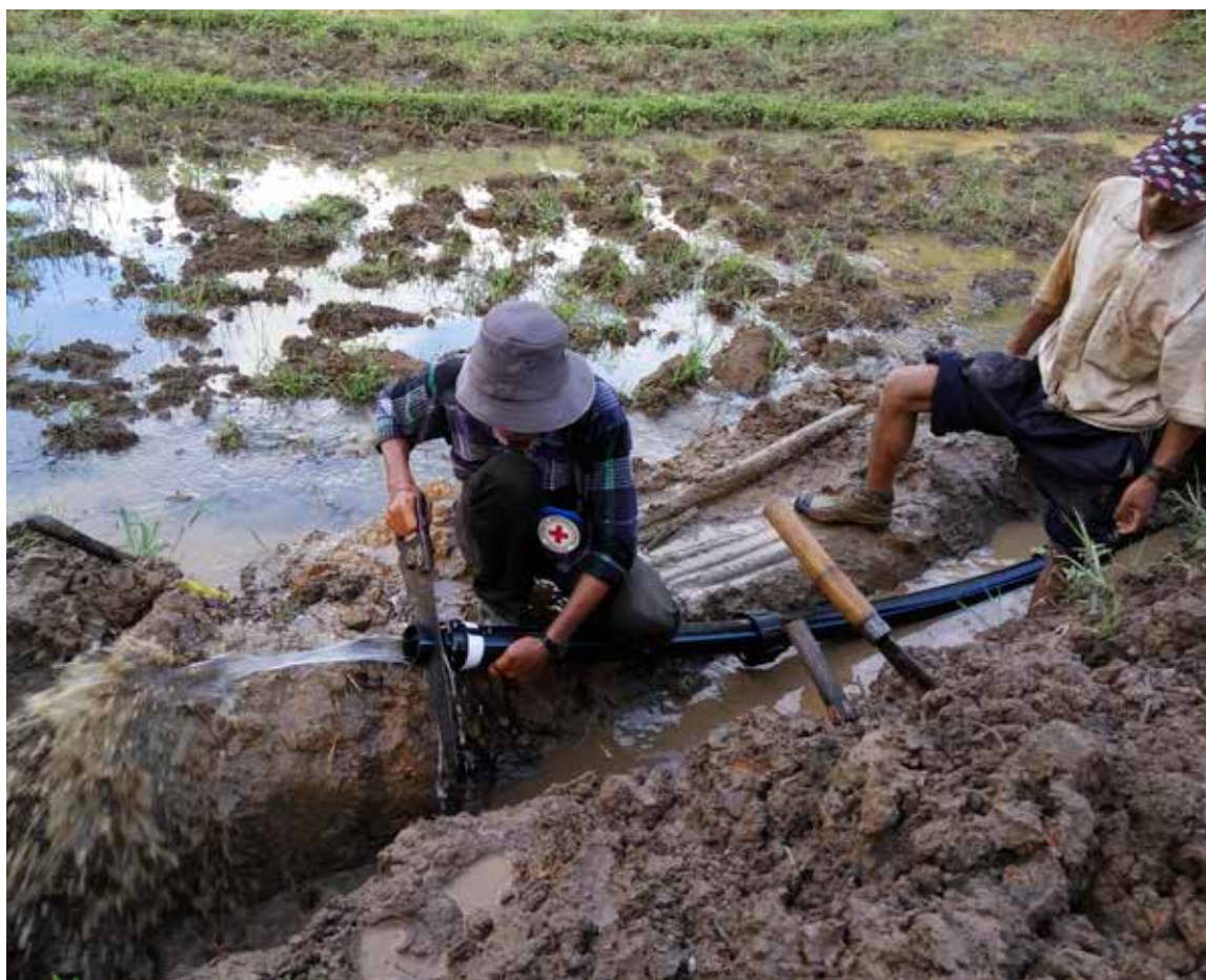
Under 2016 byggde Svenska Röda Korsets tekniska delegat vattenbrunnar och skoltoiletter i Myanmar. På bilden renoveras ett vattensystem i norra Shan State, Mong Si-området.

För att säkerställa handlingsberedskap i samband med större kriser och katastrofer har Svenska Röda Korset ett eget kapital som alltid ska uppgå till minst ett års normal verksamhetskostnad. För närvarande uppgår det egna kapitalet till omkring en miljard kronor. Förvaltningen av kapitalet styrs av den placeringspolicy som Svenska Röda Korset fastställer årligen.