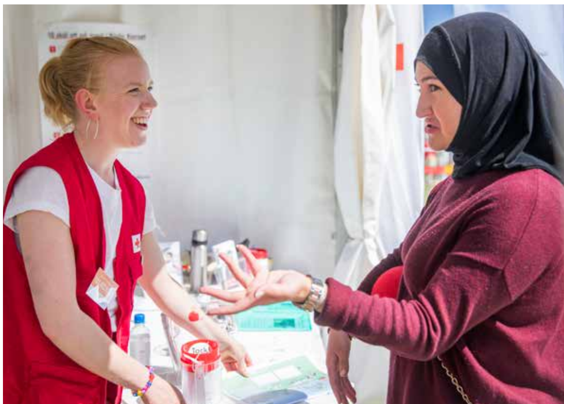
Frivilliga i Röda Korsetkretsen i Sundbyberg deltar i nationaldagsfirande.

Ökad hållbarhet, öka människors deltagande och etablering i samhället.