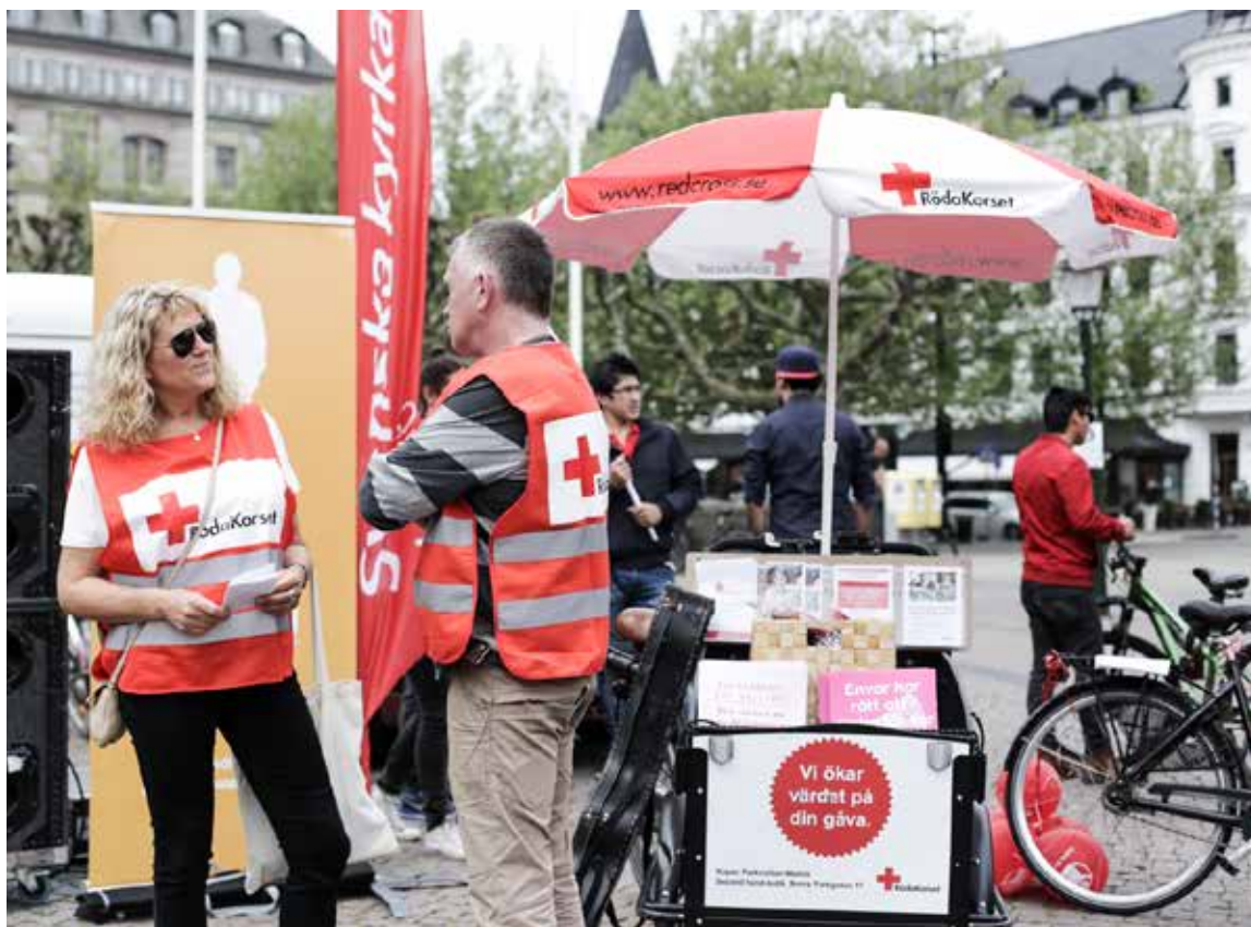
Manifestationen "Alla barns rätt till sin familj" på Stortorget i Malmö, maj 2016.